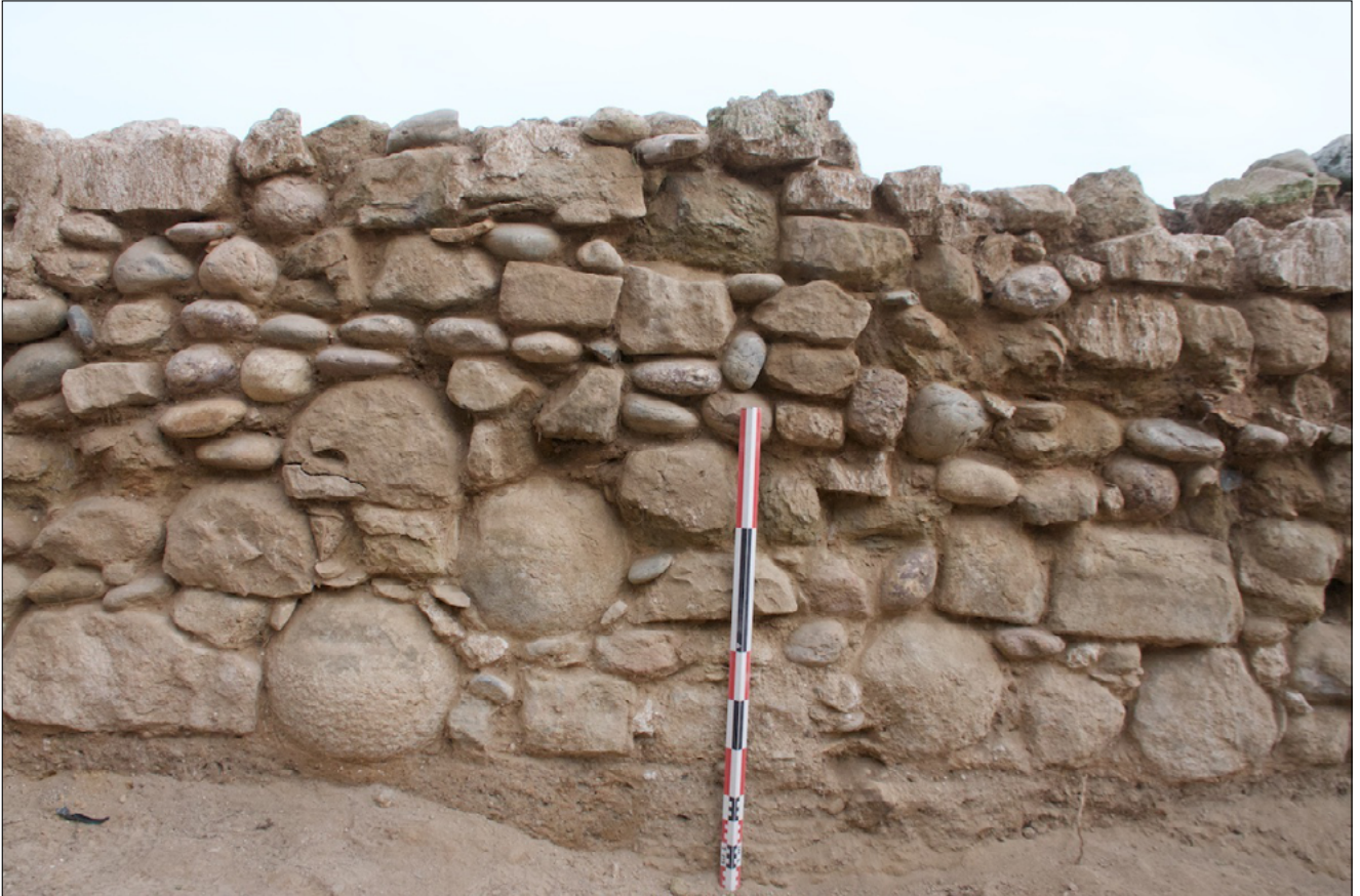
Figura 7. Detall de les bombardes reutilitzades en la construcció del baluard.

pogut documentar a l'alçada de la boca i, per tant, en algun moment, es deuria produir un rebaix important d'aquesta zona.