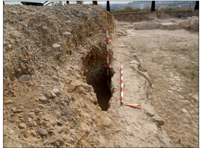
Figura 3. Detall de la sitja UE 325, anul·lada per la construcció de la gran cambra.