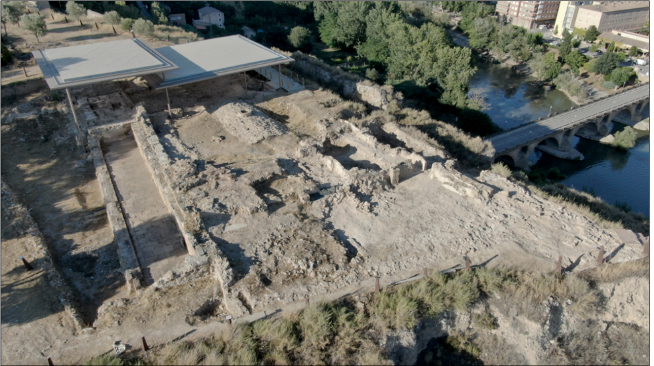
Figura 1. Vista general de la zona en procés d'excavació del Castell Formós de Balaguer.

El mateix any 1972, Juan Zozaya va obrir quatre cales en el sector sud-oriental. A partir d'aquest any s'iniciaren les reconstruccions d'alguns sectors de la muralla. Fou també durant aquesta actuació que es va arrasar tota l'excavació de l'any 1971 fins a nivells de fonamentació i es van arrancar totes les conduccions d'aigua decorades amb alicatats. Malauradament, d'aquests treballs no hi ha cap informe ni documentació fotogràfica.