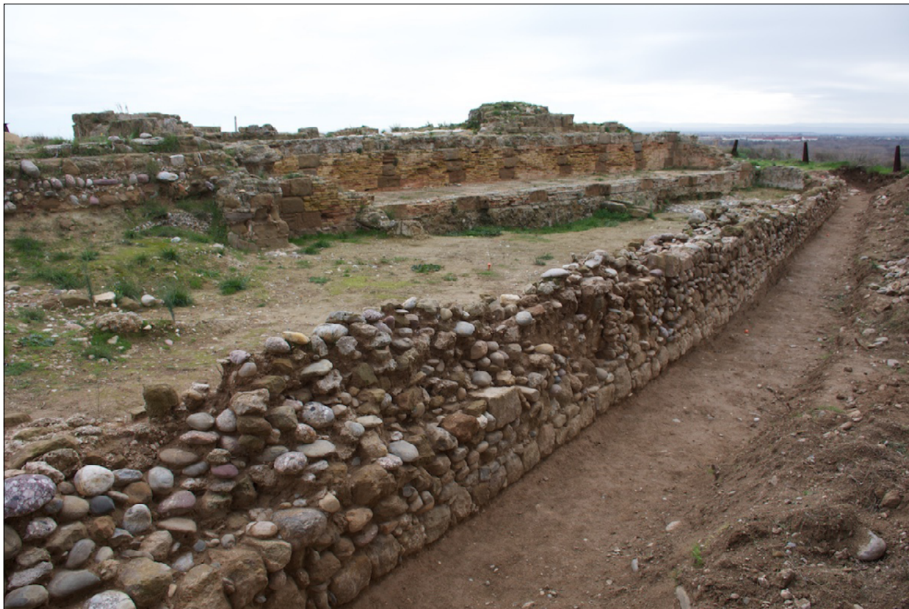
Figura 6. Vista general del baluard del segle XVII.

Està clar que en el moment de construir-la es va produir un gran rebaix de tota la superfície que ocupa, que va afectar els estrats naturals, sobre els quals es van assentar els fonaments.