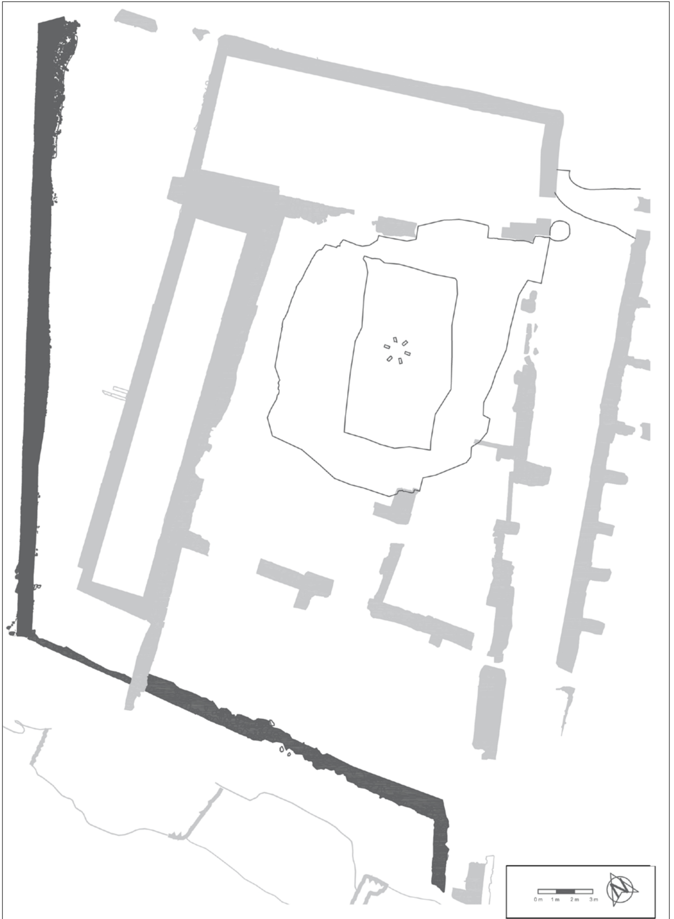
Figura 5. Planta general de les estructures militars d'època moderna. Planimetries Carme Brusau